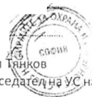
Ангел Тянков Председател на УС на СФОС